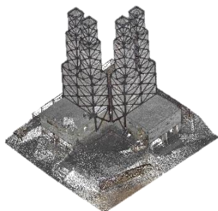
韮山反射炉（世界遺産）