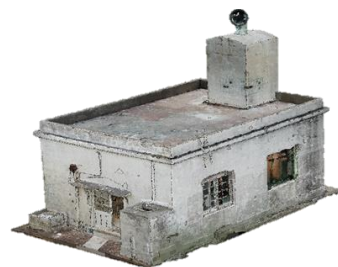
野島埼灯台霧信号舎