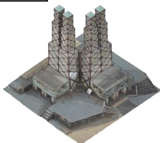
韮山反射炉（世界遺産）